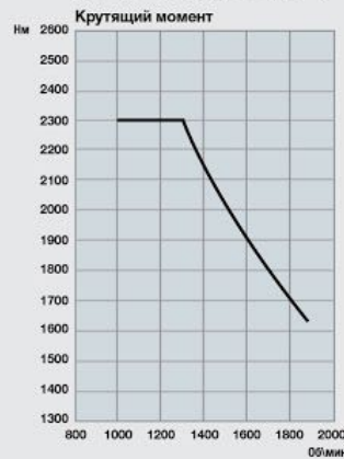
DC 13 102 440 Euro 4