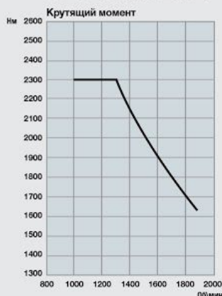
DC 13 102 440 Euro 4