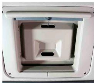
Люк в крыше