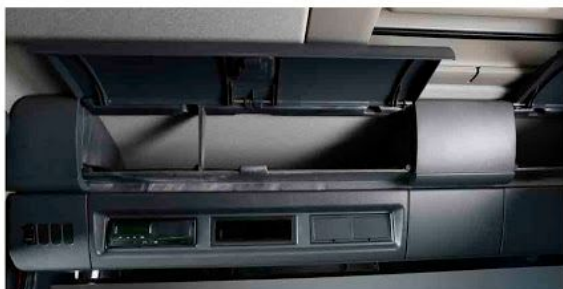
Верхние вещевые полки