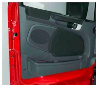
Внутренняя сторона дверей