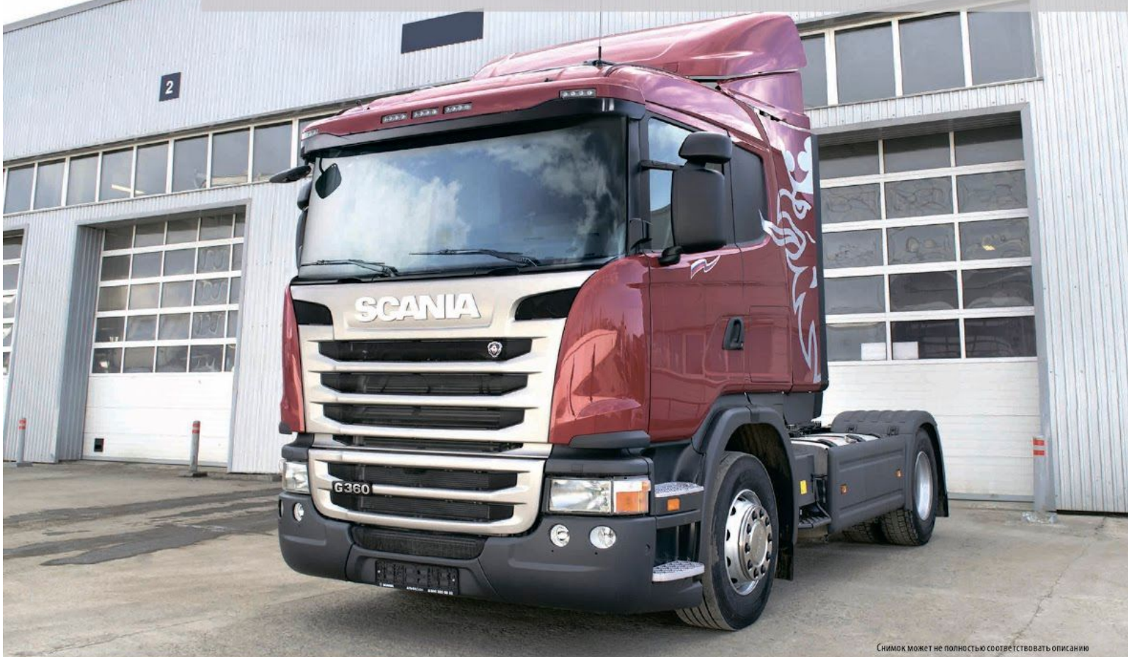
Снимок может не полностью соответствовать описанию