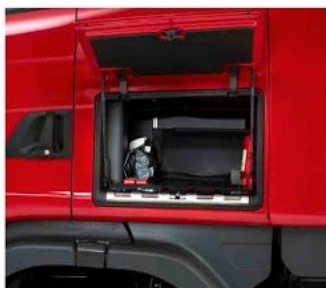
Наружный вещевой ящик