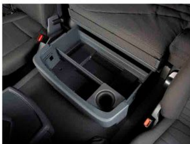
Задний вещевой ящик