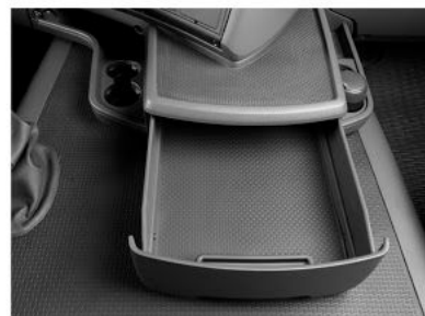
Передний вещевой ящик