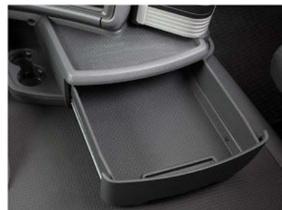
Передний вещевой ящик