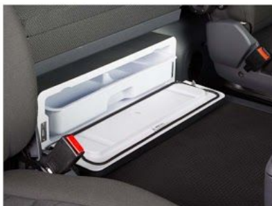
Задний вещевой ящик