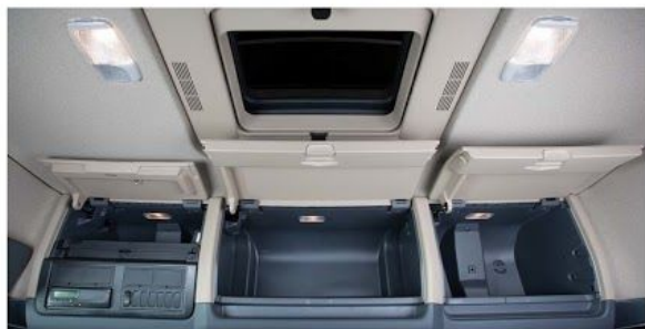
Верхние вещевые полки с люком в крыше