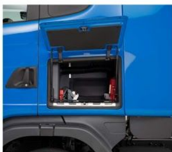
Наружный вещевой ящик