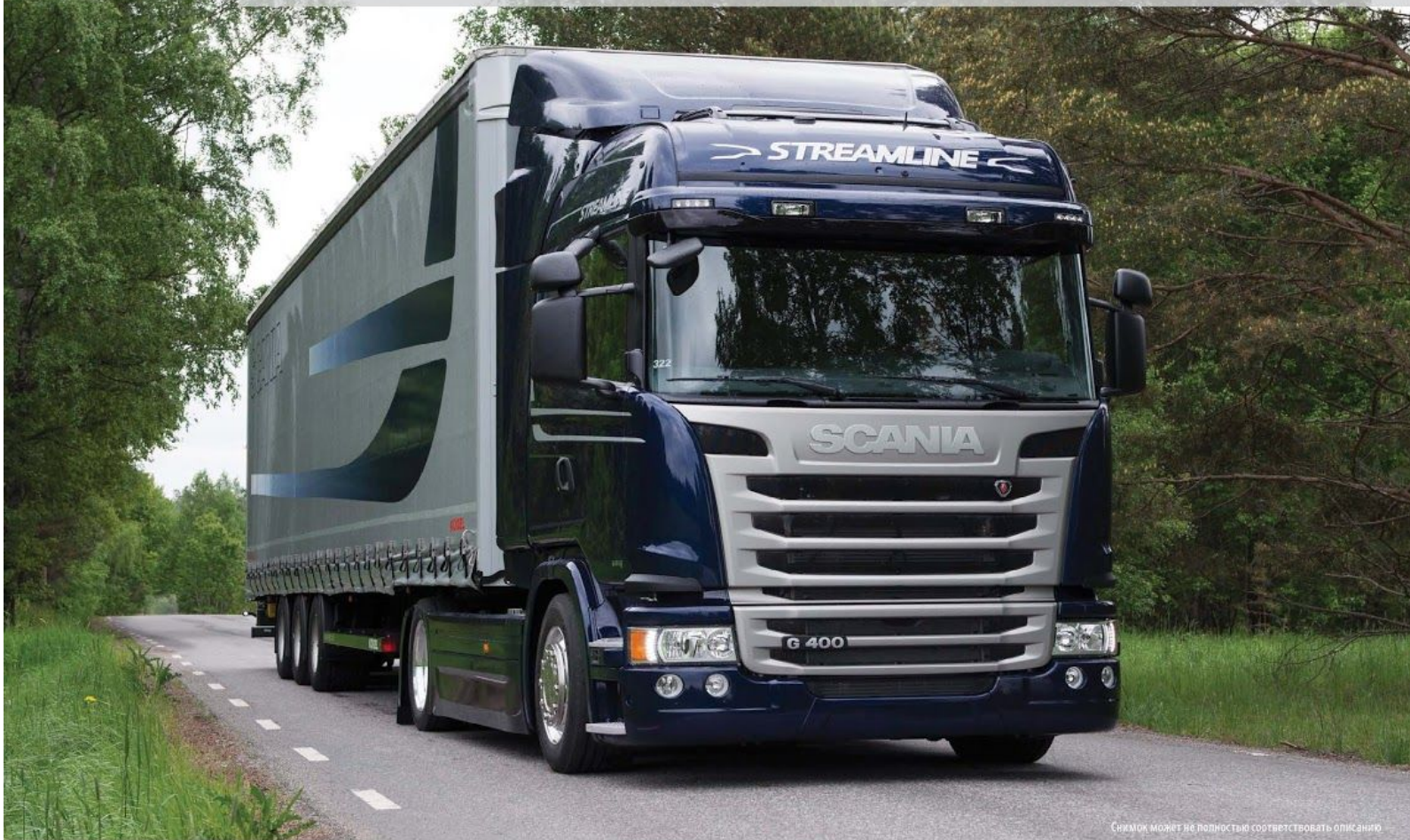
СНИМОК МОЖЕТ НЕ ПОЛНОСТЬЮ СООТВЕТСТВОВАТЬ ОПИСАНИЮ