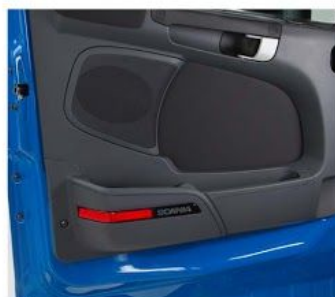
Внутренняя сторона двери